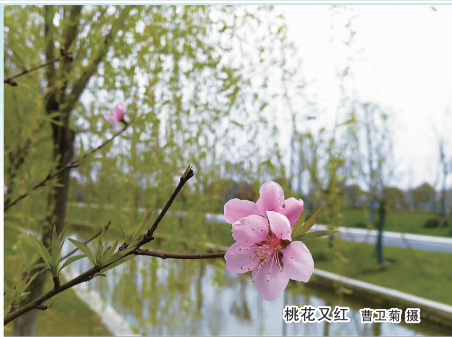
桃花又红