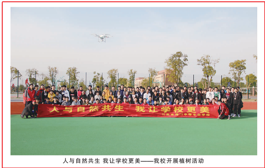
人与自然共生 我让学校更美——我校开展植树活动

学校的发展从根本上取决于其是否有利于学生的完整全面发展,是否能培养社会与经济发展真正需要的人才。对照核心素养框架,如何以学生的发展为本,以核心素养的培养为旨归,我们依旧有很长的路要走。(杨一丹)