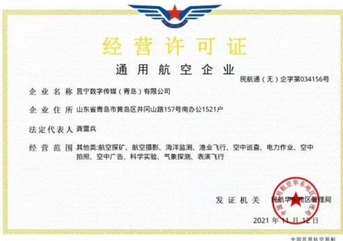
图15 昱宁数字传媒（青岛）有限公司经营许可证