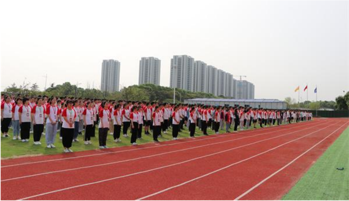
图19 中南学院举行新学期第一次升国旗仪式