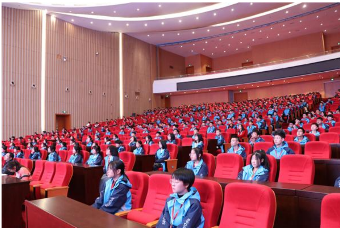
图12 学生听取红色思政课