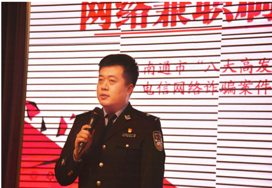
图14 “警民同心 反诈青春行”为主题的反诈宣讲