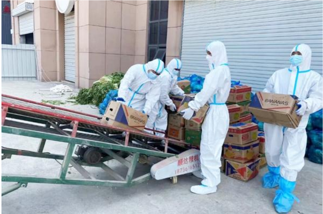
图30 抗疫志愿者服务队在运送抗疫物资