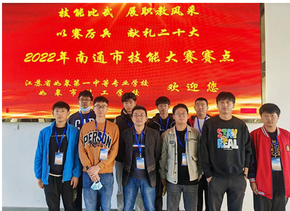
图7 技能大赛部分参赛师生合影

2022年11月13日，南通市职业学校技能大赛组委会公示了2022年南通市职业学校技能大赛成绩，学校共获一等奖23人次、二等奖16人次、三等奖50人次、奖牌总数89人次，金牌获奖人次位列南通市第二、总奖牌数位列第三。本届大赛在疫情形势严峻、选手集训时间大为缩减的情况下，各系院均能克服困难、积极应对。26个项目参赛师生积极备赛，各部门、各系院团结协作，精心安排。防疫安全与组织比赛两手抓，圆满完成6个项目，155名选手的组赛工作，8个赛点150名师生的送赛工作。本次大赛学校保持了禽病综合诊断、车身修复、工程测量、沙盘模拟企业经营、建筑CAD等项目的优势，并在建筑装饰技能、艺术表演等项目上有了一等奖新突破。