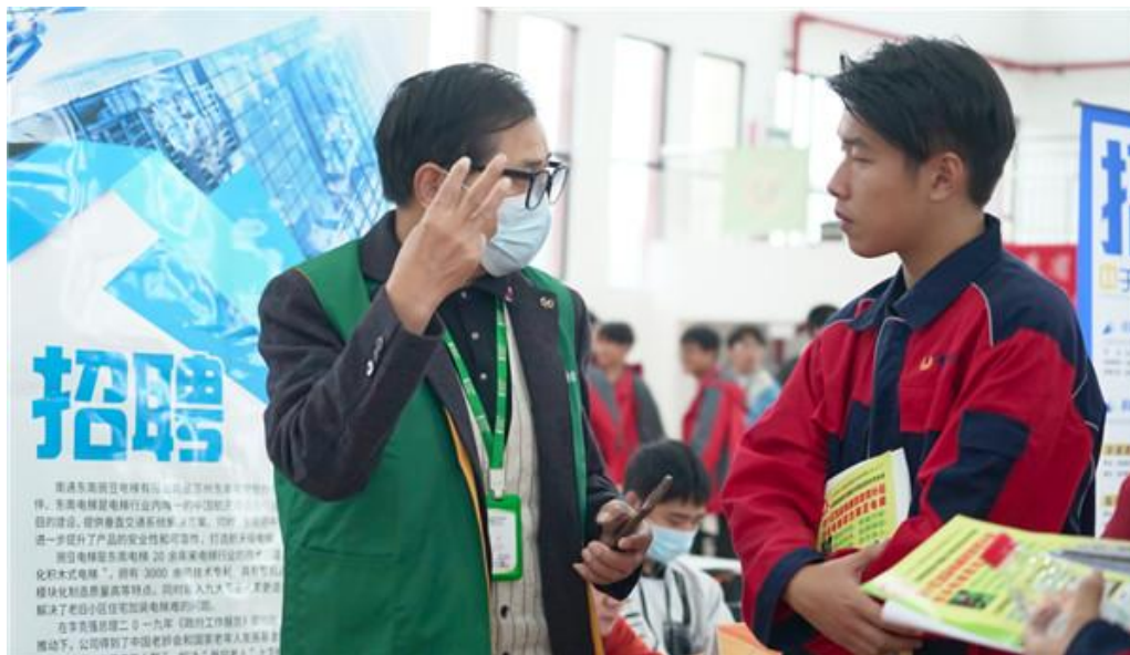
图21 “校企见面会”企业招聘活动现场

校将继续做好人才培养，加大与地方企业的合作力度，全力担负起服务地方经济，共建美丽海门的历史使命。