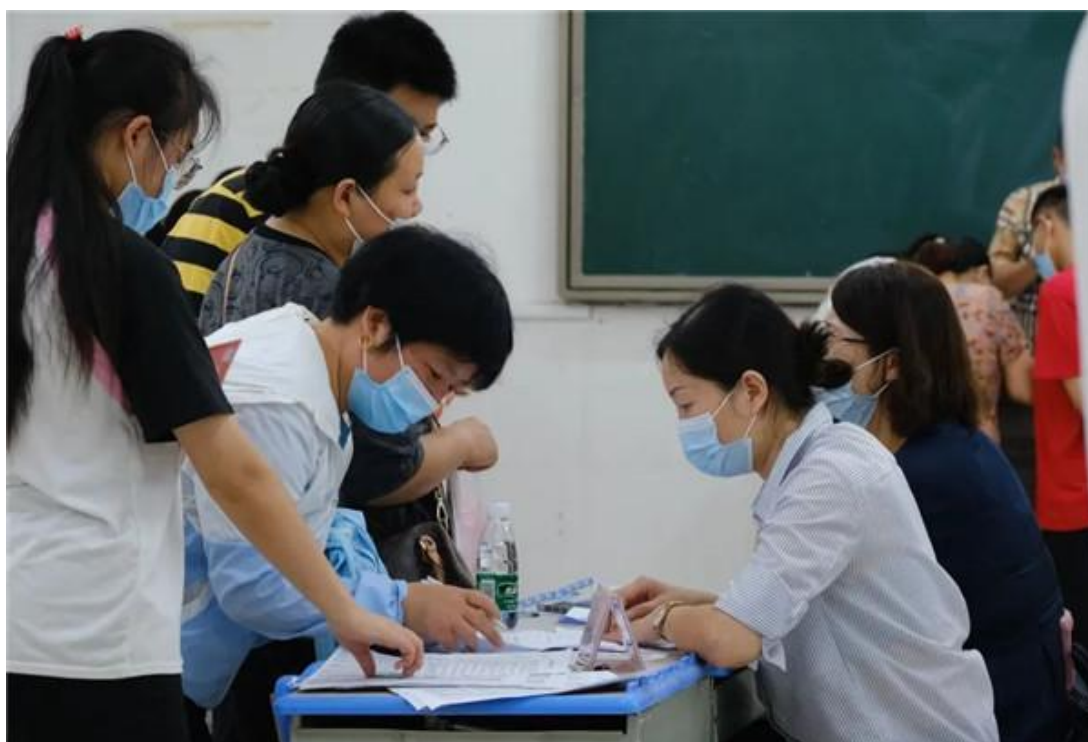
图4 2022年新生报名咨询登记