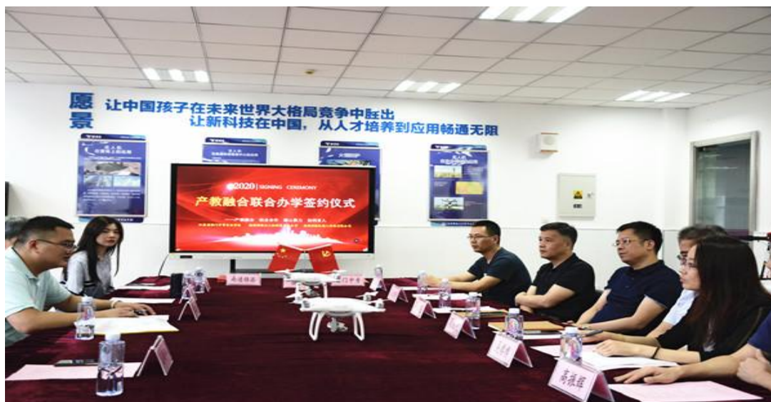
图 26 海门中专与南通锦添无人机科技有限公司签约仪式

三是学校注重技术研发和培训。留在当地就业、到中小微企业等基层服务是毕业生最重要的两种服务途径。优秀毕业生直通企业,成为企业员工,企业产出对接教育服务,为学生发展赢得广阔空间。非学历培训服