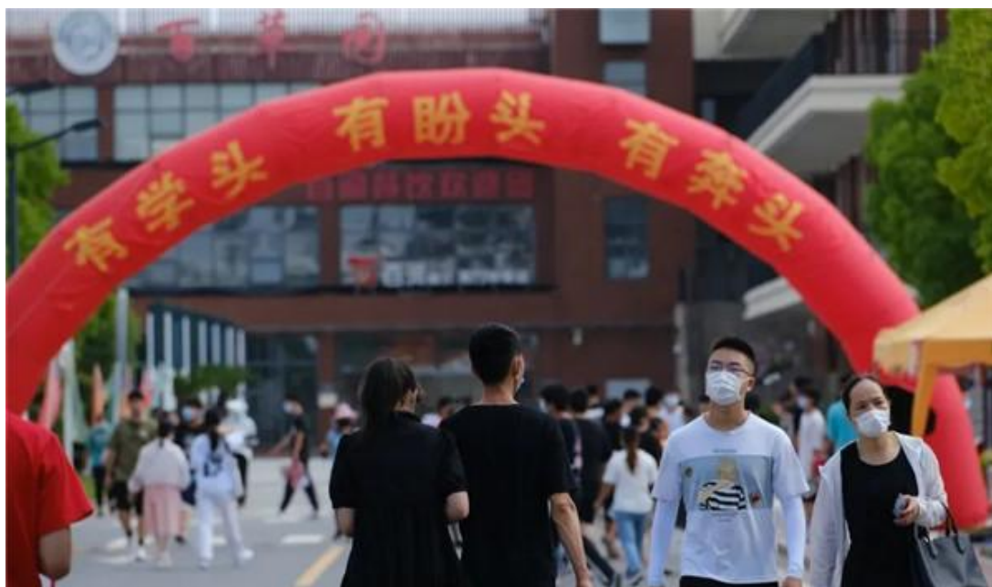
图3 2022年新生报名现场