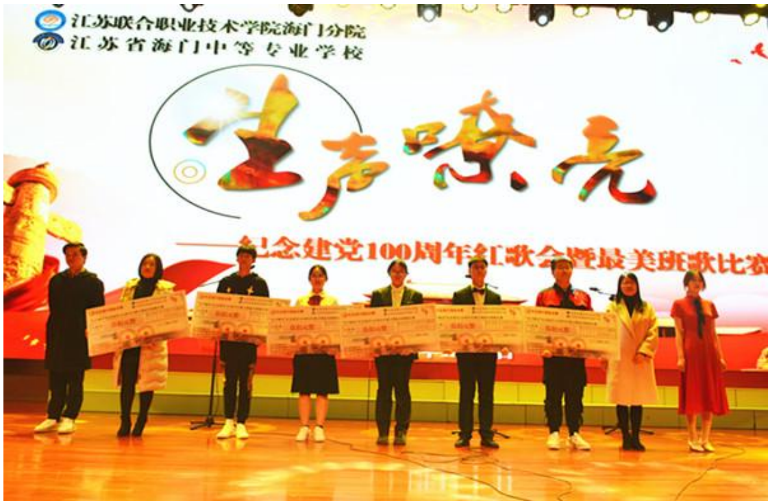
图6 “生声嘹亮” 比赛颁奖