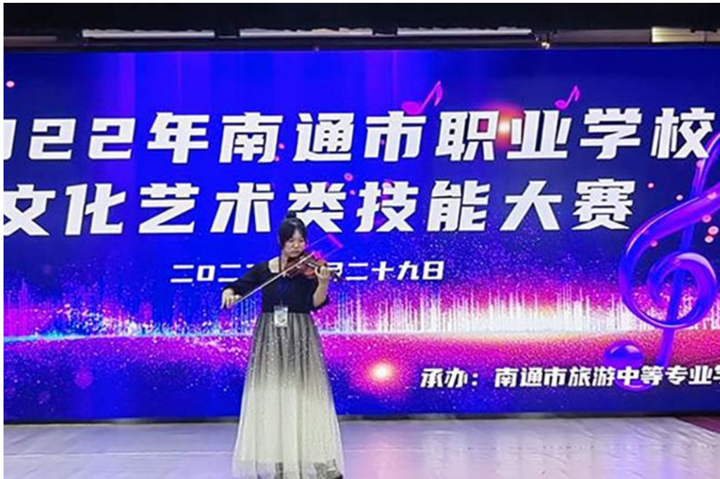
图8 技能大赛选手角逐赛场镜头