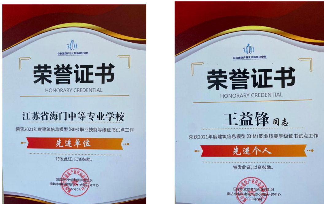
图9 BIM考证试点工作获奖证书