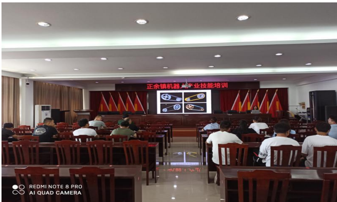
图 27 海门中专对振康公司员工进行技术培训

为了把技术真正送到正余镇高科技企业，应正余振康公司的邀请，海门中专本着对社会负责的态度，派出最优秀的教师把技术带到正余镇企业，为企业职工进行免费培训。本次培训由正余镇社区教育中心协助组织开展。