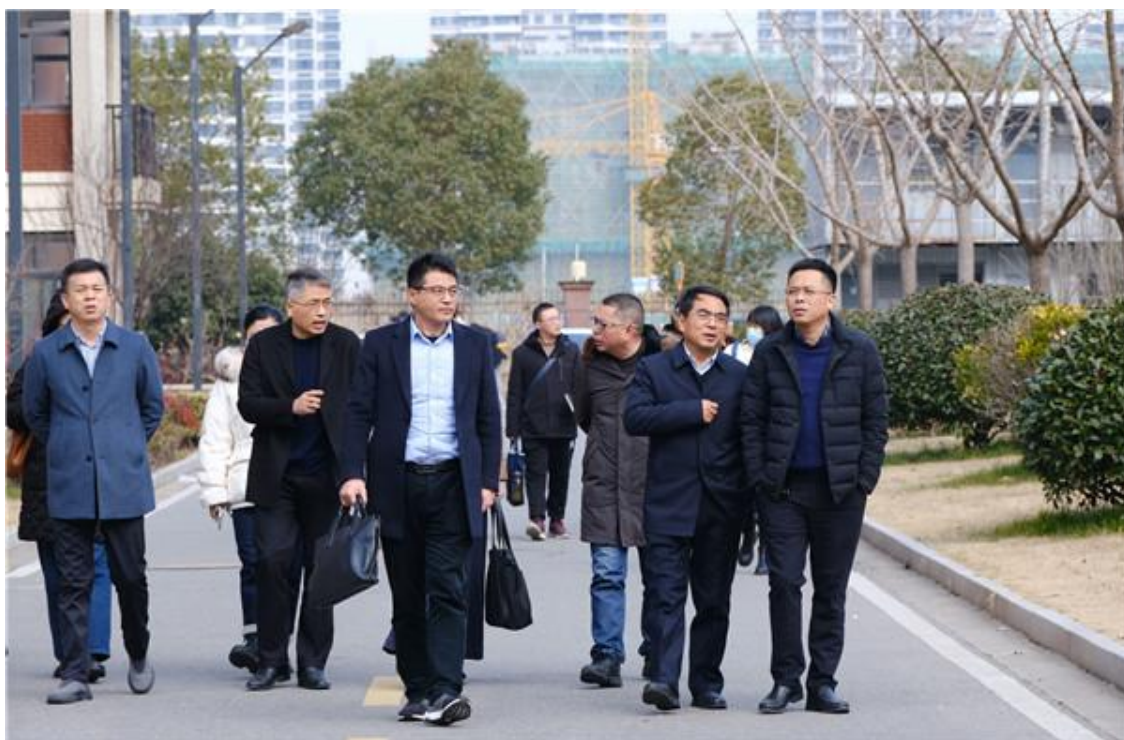
图 28 泰州市职业教育代表团一行参观学校校园