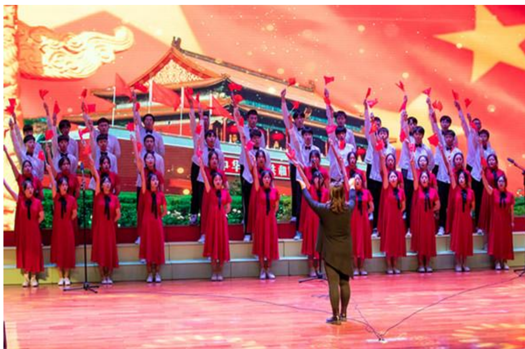
图5 “生声嘹亮”比赛展示

海门中专举办“生声嘹亮”纪念建党100周年红歌会暨最美班歌比赛。六大系部12支合唱队参加“红歌比赛”和“最美班歌”两个环节比拼，最终交建系获得“红歌比赛”一等奖，信息系获得“最美班歌”一等奖；信息系和交建系共同获得最佳唱响组织奖。活动的开展既激发学生的爱党爱国热情，增强实现中华民族伟大复兴的使命感和责任感，又展示学校“唱响校园”活动开展成效。