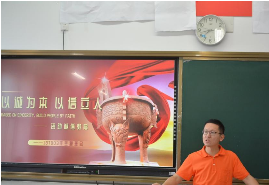
图13 “资助诚信”主题班会